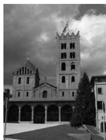
Fig. 4 - Santa Maria de Ripoll