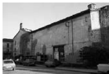
Fig. 15 - Santa Magdalena dels agustins de la Seu d'Urgell