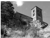
Fig. 44 - Sant Esteve d'Abella de la Conca