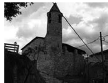
Fig. 46 - Sant Joan de Beranui