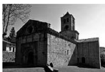
Fig. 5 - Sant Pere de Camprodon

Les 1.259 finques estaven situades en 158 pobles: 86 a la província de Girona (39 a l'Alt Empordà, 22 a la Cerdanya, 21 al Ripollès, 2 a la Selva i la Garrotxa, i 1 al Gironès), 36 a la de Lleida (13 al Pallars Sobirà, 8 a l'Alt Urgell, 5 al Pallars Jussà, 3 a l'Alta Ribagorça, 2 a la Noguera, el Segrià i la Segarra, i 1 a l'Urgell), 34 a la de Barcelona (18 al Barcelonès, 11 al Berguedà, 2 al Bages i Osona, i 1 al Vallès Oriental) i 3 a la Catalunya Nord (1 al Conflent, 1 al Rosselló i 1 al Vallespir). A l'inici sols s'arrendaren els delmes i les finques amb l'obligació de respectar els parcers. Tot era tan confús que els franciscans de Girona s'allotjaren en cases amigues, a veure-les venir i en moriren a la ciutat fins al 1841, quan l'arquitecte municipal de la ciutat, carlí, Bru Barnoya i Xiberta, decidí obrir el carrer Nou travessant l'església del cenobi, perquè no poguessin tornar mai més, un gest que desconcertà.