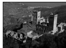
Fig. 6 - Sant Pere de Roda

Al Pirineu, les comunitats femenines no foren solament taxades com arreu de Catalunya, sinó que es posaren en venda 27 finques de les clarisses de Puigcerdà i 1 de les Monges de l'Ensenyança de la Seu, per la bondat de les terres i el nul o gran interès dels polítics locals per adquirir-les. Això ocorregué atès el poc que s'aconseguí de les vendes precedents, en pagar-se en títols inflacionats i en declarar-se molts compradors en fallida, una trampa que consistia a decretar una segona subhasta a un preu més baix, fer comprar la finca a un home de palla, que la transferia a l'antic comprador.