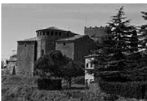
Fig. 17 - Santa Maria de Serrateix