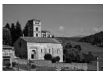
Fig. 60 - Santa Cecília de Molló