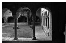
Fig. 87 - Claustre del priorat de Santa Maria de Cervià