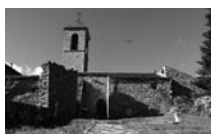
Fig. 37 - Sant Andreu de Baltarga, fotografia de Ricard Balló de 2015