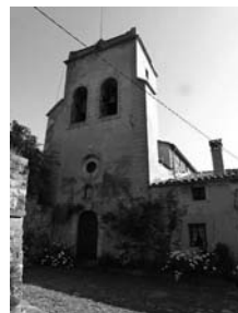
Fig. 86 - Sant Julià de Tregurà