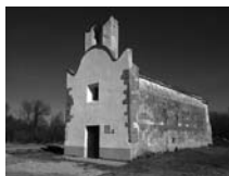
Fig. 35 - Sant Joan Sescloses