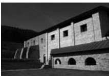
Fig. 24 - Priorat de Sant Llorenç prop Bagà