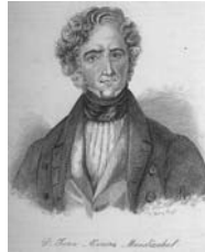
Fig. 1 - Esbós de Juan de Dios Álvarez Méndez Mendizábal

El 1835 davant del tresor exhaust, el ministre d'Hisenda, Juan de Dios Álvarez Méndez Mendizábal (Chiclana de la Frontera, 1790 – Madrid, 1852) (figura 1), en lloc d'augmentar els impostos a la població, com Montoro, decidí guanyar la guerra als carlins posant en venda els béns de l'Església. Imità el que es féu després de l'expulsió dels jesuïtes i que repetiren els ministres Soler-Godoy, els francesos i el Trienni Liberal. Ho acabarà Pasqual Madoz (Pamplona, 1806 – Gènova, 1870) (figura 2) durant el Bienni Progressista però és una part de la història mal resolta, que cal reconsiderar.