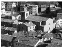
Fig. 52 - La Pobla de Lillet