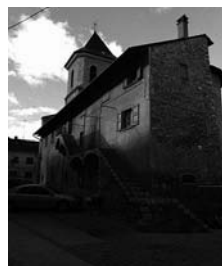
Fig. 70 - Alp