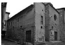
Fig. 20 - Sant Joan de Berga de la Mercè