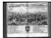
Fig. 28 - La Seu d'Urgell l'any 1781, gravat de Francisco Palomino, Biblioteca Marià Vayreda d'Olot