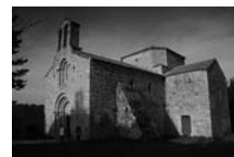
Fig. 27 - Priorat de Sant Pere Cercada