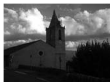
Fig. 83 - Sant Sadurní d'Enveig