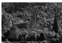
Fig. 31 - Santa Maria de Gerri de la Sal