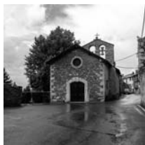
Fig. 48 - Sant Julià d'Aja