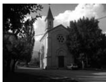
Fig. 68 - Sant Jaume de Rigolises