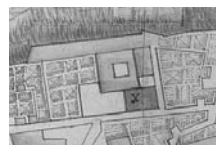
Fig. 10 - Santa Clara de Puigcerdà a l'interior de la muralla en un plànol de 1717