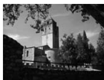
Fig. 38 - Sant Llorenç de la Muga