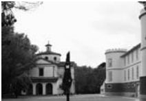
Fig. 80 - Torre del Remei de Bolvir

el molí d'Alòs (figura 79) del capítol de la Seu, 12 propietats a Montsonís del Carme de Salgar i la torre Neral o Castell del Remei de Bolvir (figura 80) per 1.184.320 rals, 20 jornals de la darrera, foren ocupades pel canal d'Urgell, amb una clara intenció hotelera. Comprà també moltes cases a Barcelona i cases, molins i terres a Lleida per valor de 6.159.140 rals, que el convertiren en el setzè contribuent industrial de Barcelona. Conjuntament amb el fill Joan, diputat provincial i comprador, instal·là un taller de màquines de vapor a Vilanova i la Geltrú.