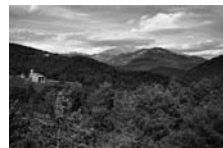
Fig. 50 - Sant Feliu d'Estiula