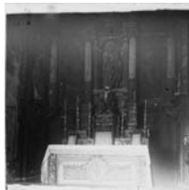
Fig. 64 - Retaula de Freixenet, fotografia de Josep Salvany, Biblioteca de Catalunya