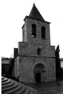
Fig. 65 - Sant Esteve de Llanars