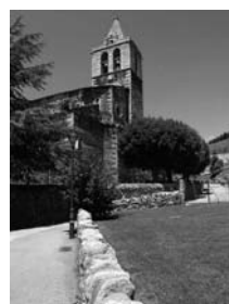
Fig. 30 - Santa Maria dels Àngels de Llívia