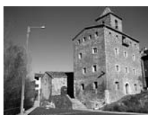
Fig. 33 - Església vella del Pont de Suert