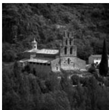
Fig. 11 - Santa Maria de Gerri de la Sal