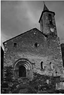
Fig. 79 - Sant Llister d'Alòs d'Isil