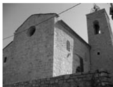
Fig. 69 - Santa Maria d'All