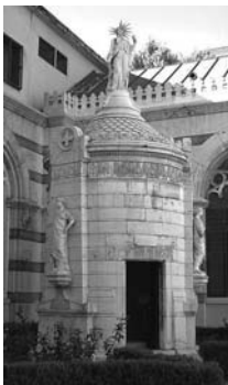
Fig. 72 - Panteó a Mendizábal, Argüelles i Calatrava, a Madrid