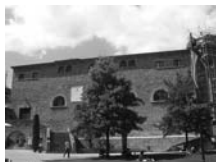
Fig. 89 - Sant Pere de Ripoll

a BN, durant el Trienni, el priorat de Santa Maria de Cervià de Ter dels benets de Sant Pere de la Portella-Sant Pau del Camp (figura 87), consistent en el priorat i 15 peces de terra de regadiu, cultives, ermes i boscoses per 676.694 rals, per convertir-la en una hisenda modèlica, com les descrites al periòdic La Granja de Figueres editat per l'hisendat Narcís Fages de Romà, bon amic de la família. Un darrer grup de compradors, que són els més políticament compromesos, es dedicaven al comerç i la indústria però sobretot a la mineria.