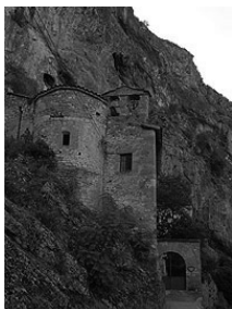
Fig. 13 - Carme de Salgar