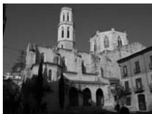
Fig. 88 - Sant Pere de Figueres