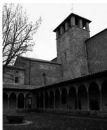
Fig. 29 - Sant Joan de les Abadesses

Puigcerdà tenia 46 propietats provinents 23 de les clarisses, 19 dels dominics i 4 dels agustins. Els dominics arrodinien les terres amb 21 propietats a Queixans, 16 a Llívia i 14 a Baltarga, mentre que els agustins en posseïen 15 a Rigolisa i les clarisses 4 a Prats (figura 45).