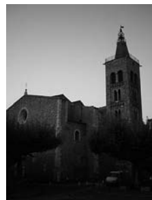
Fig. 54 - Sant Pere de Prada de Conflent