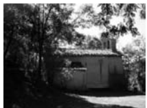
Fig. 51 - Sant Martí d'Armancies