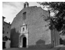
Fig. 55 - Sant Pere de Ceret

Les institucions seculars en nombre de 94 posseïen 606 finques al Pirineu, de manera que la mitjana era de 63 finques per a cada una, superior a les 26 dels cenobis. De les 94 institucions, 71 eren gironines, 18 lleidatanes i 5 berguedanes.