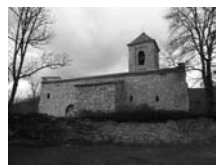
Fig. 57 - Sant Llorenç de Campdevàno