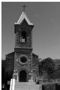
Fig. 40 - Sant Martí d'Urtx