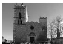
Fig. 32 - Sant Julià i Santa Basilissa de Fortià