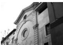
Fig. 16 - Església de la Immaculada de les monges de l'Ensenyança de la Seu d'Urgell