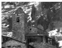
Fig. 36 - Civís