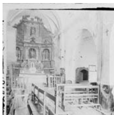
Fig. 45 - Retaule de Prats