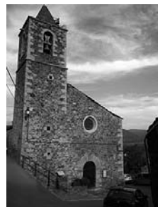
Fig. 42 - Santa Coloma de Ger