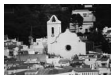
Fig. 66 - Santa Maria de les Neus de Port de la Selva