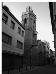
Fig. 59 - La Jonquera