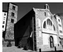
Fig. 81 - Sant Julià i Sant Germà de Sant Julià de Lòria