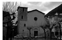
Fig. 7 - Carme Calçat de Camprodon