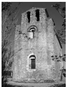
Fig. 47 - Sant Esteve de Pedret i Marzà