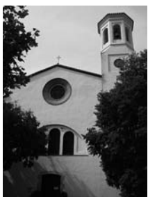
Fig. 71 - Selva de Mar