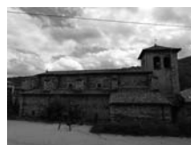
Fig. 58 - Sant Martí de Vilallonga de Ter