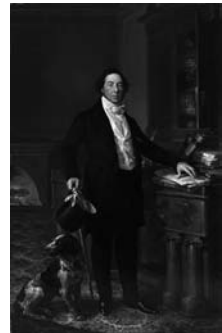
Fig. 77 - Vicente Lòpez Portaña, Retrat de Gaspar de Remisa i Miarons, marquès de Remisa