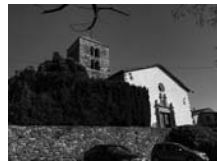
Fig. 78 - Santa Margarida de la Quart