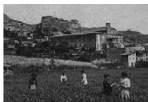
Fig. 21 - Sant Francesc de Berga, fotografia anterior a 1936