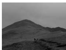
Fig. 67 - Muntanya de Fontlletera a Tregurà de Dalt