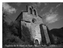
Fig. 62 - Sant Martí de Tost, fotografia de Ricard Balló de 2011