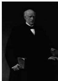
Fig. 2 - Josep Nin i Tudó Retrat de Pasqual Madoz , Madrid, Congrés dels Diputats

Les propietats es trobaven en zones properes a la Catalunya Nord i Andorra i abraçaven vuit comarques, de l'Alta Ribagorça a la Noguera, els Pallars Sobirà i Jussà, l'Alt Urgell, la Cerdanya, el Ripollès i l'Alt Empordà, que allargarem al Berguedà, per gentilesa envers els nostres organitzadors.