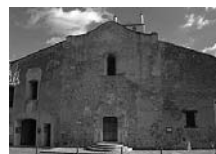
Fig. 22 - Priorat de Saint Genis des Fontaines