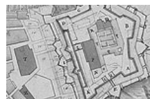
Fig. 9 - Sant Agustí de Puigcerdà a l'interior de la muralla en un plànol de 1717