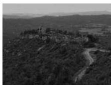
Fig. 53 - Grevolosa