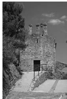
Fig. 56 - Masarac