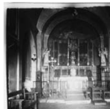
Fig. 82 - Retable de Saneja