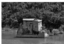
Fig. 23 - Priorat de Sant Salvador de la Vedella