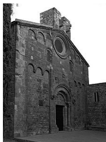
Fig. 19 - Sant Pau del Camp de Barcelona