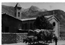
Fig. 61 - Gósol, fotografia de 1960