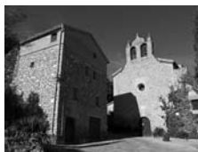
Fig. 41 - Santa Maria de Montsonís