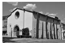
Fig. 14 - Sant Domènec de la Seu d'Urgell