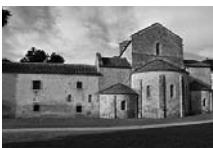
Fig. 25 - Priorat de Santa Maria de Cervià