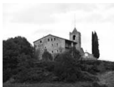
Fig. 49 - Santa Maria de Matamala