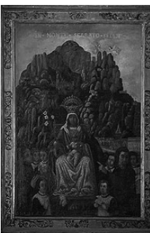
Fig. 26 - Mare de Déu de Montserrat de Sant Genis des Fontaines