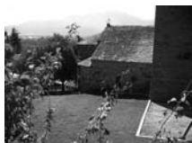
Fig. 39 - Sant Miquel d'Isòvol