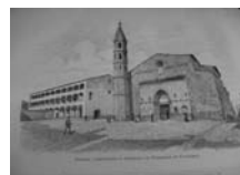
Fig. 8 - Dibuix de Sant Domènec de Puigcerdà