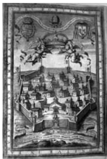
Fig. 3 - Bonaventura Tristant, Il·lustració de Corona benedictina adornada de la más preciosa de sus singulares prerrogativas , Barcelona, Rafael Figueró, 1677