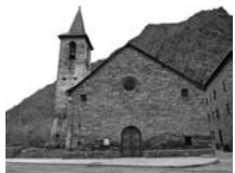
Fig. 43 - Sant Vicenç d'Alins