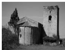
Fig. 18 - Sant Pere de la Portella