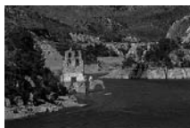
Fig. 12 - Santa Maria de Lavaix